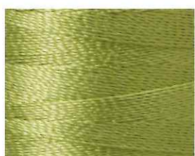
若葉色 (わかばいろ)