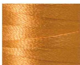
蜜柑色 (みかんいろ)