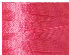
桜桃色 (おうとういろ)