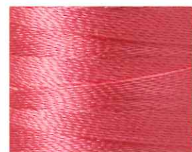
紅梅色 (こうばいいろ)