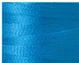
ターコイズブルー