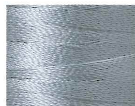
深川鼠 (ふかがわねずみ)